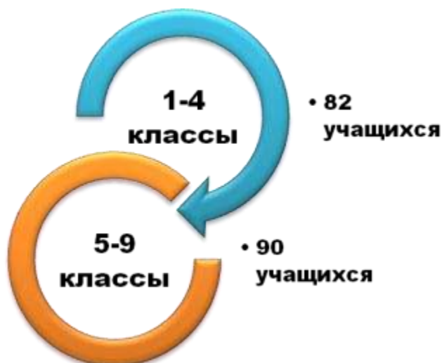
Рисунок 1. Качественная и количественная характеристика учащихся