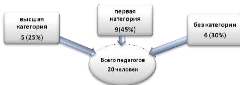
Рисунок 2. Качественная и количественная характеристика педагогов

Количество педагогов школы, имеющих квалификационные категории по итогам 2017-2018 учебного года (рисунок 2):