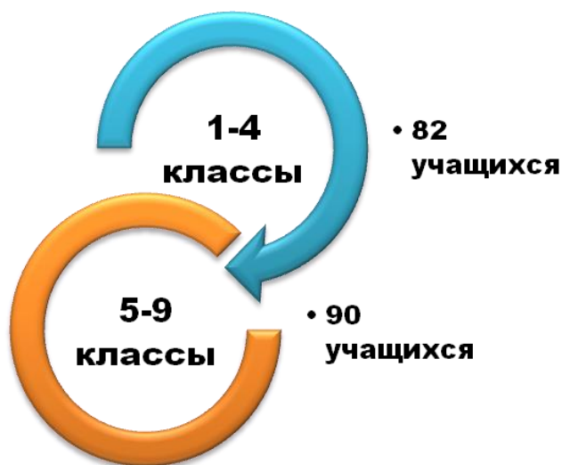
Рисунок 1. Качественная и количественная характеристика учащихся