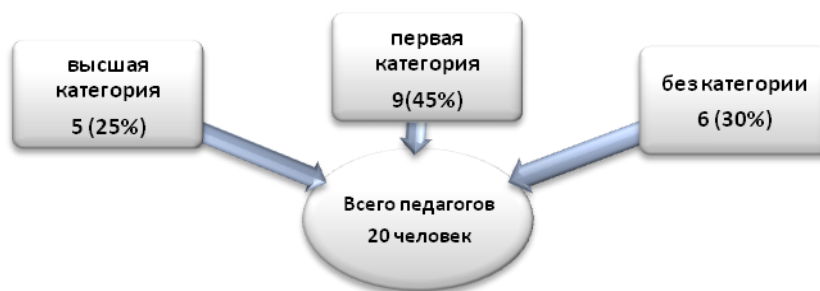
Рисунок 2. Качественная и количественная характеристика педагогов

За последние 3 года все педагоги прошли курсы повышения квалификации.